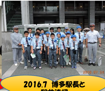
2016.7 博多駅長と 駅前清掃