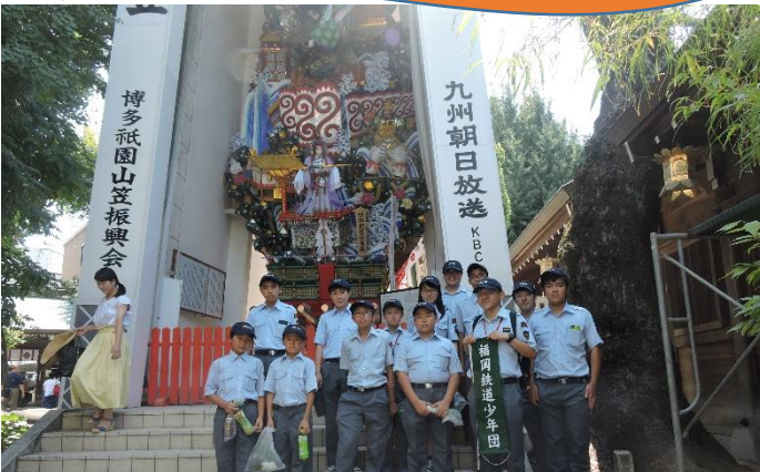
2018.7 櫛田神社飾り山笠