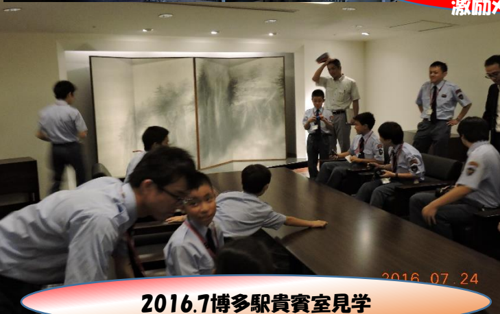
2016.7博多駅貴賓室見学