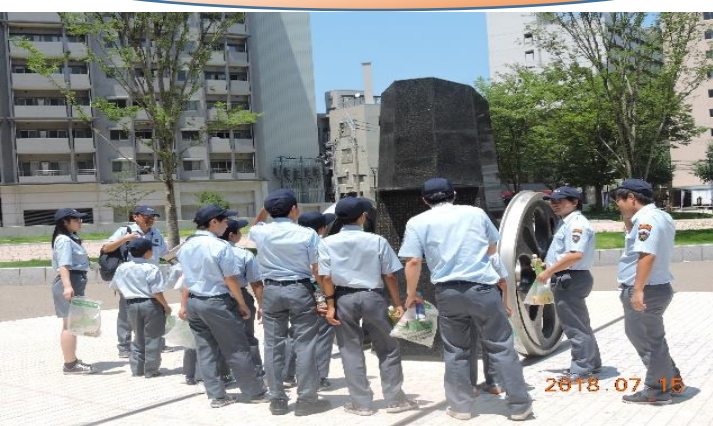
2018.7九州鉄道発祥の碑(旧博多駅跡)