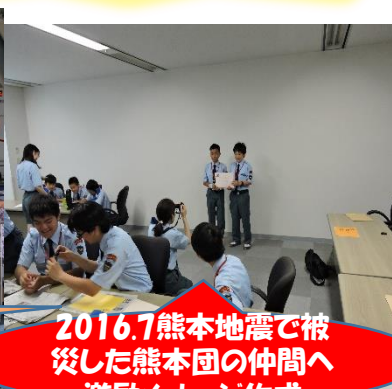
2016.7熊本地震で被災した熊本団の仲間へ 激励メッセージ作成