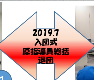
2019.7 入団式 原指導員総括 退団