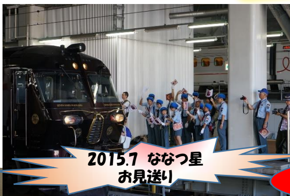
2015.7 ななつ星 お見送り